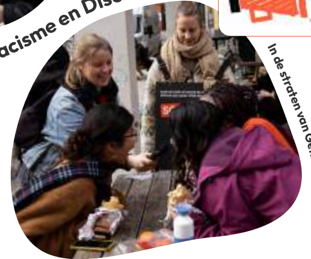
In de straten van Gent