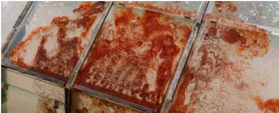
Ster Borgman - Roest

Roest lijkt onbeweeglijk, zo getuigt ook de term vastgeroest, maar het breidt zich in feite uit. Zelf voelde Borgman zich lange tijd niet thuis in het dorp waar die opgroeide, er leek op het platteland geen plek te zijn voor diens queer identiteit. Door tijdens het afstuderen bezig te zijn met de tuinkas, en de