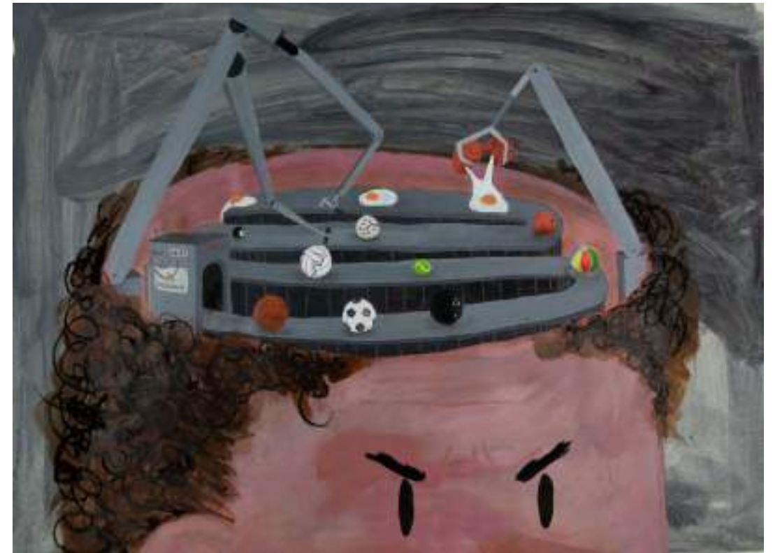
Indra Fancello - Taalillustratie

van de Belgische jeugdvoetballers komt regelmatig in aanraking met discriminatie. (KU Leuven)